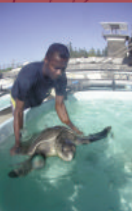
centre de soins